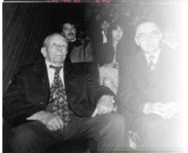
Primera Reunión Regional del Servicio Social de la Zona Metropolitana