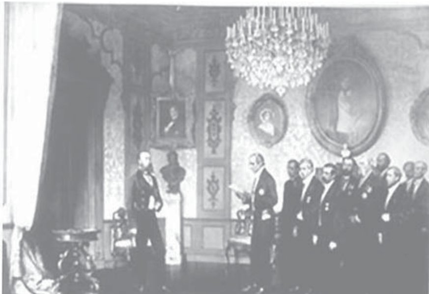
Retrato del Archiduque Maximiliano y de los miembros de la diputación mejicana que ofrecieron la Corona del imperio a salir el 3 de octubre de 1863 en Mira mar Plata-gelatina

Existe una frase que no puede estar más llena de verdad, la cual explica que la historia la escriben aquellos que se han sobrepuesto y resultan victoriosos en el campo de batalla, en este sentido escribir la historia depende cien por ciento de los factores reales del poder y en específico del oro que se le paga para escribir una versión oficial.