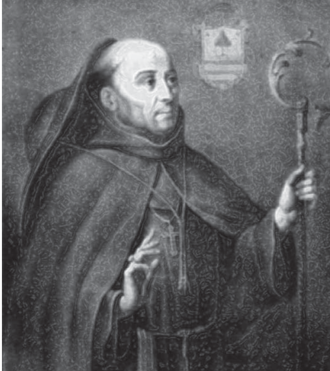
Fray Juan de Zumárraga.

Un hombre que con actitud fuerte y proactiva mantuvo una constante fricción con las autoridades religiosas, así como gubernamentales de su tiempo, situación que nunca desestimó en su ímpetu de escribir peticiones al Rey Don Carlos a quien conociera en el convento del Abrojo donde se desempeñaba como guardia e iniciara ahí mismo su profesión religiosa.