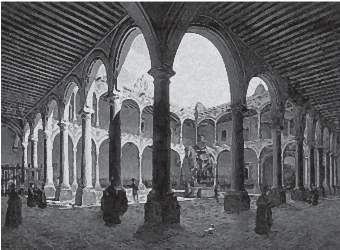
Interior de la Universidad/ Pedro Waldi / siglo XIX / óleo sobre tela / 57x41.2cm.

Si bien es cierto que la Universidad se le reconoció personalidad en el año de 1553, mismo año que en distintos puntos de la Ciudad de México iniciaran los cursos, pasarían años para que la Universidad encontrara un lugar propio “frente a la antigua Plaza de El Volador y fue el 29 de junio de 1584, cuando el arzobispo y visitador de la Universidad Pedro Moya de Contreras puso la primera piedra. Aún sin haberse terminado el edificio —por falta de fondos— se iniciaron las clases en noviembre de 1592. Y el edificio quedó terminado totalmente en 1631” 6 .