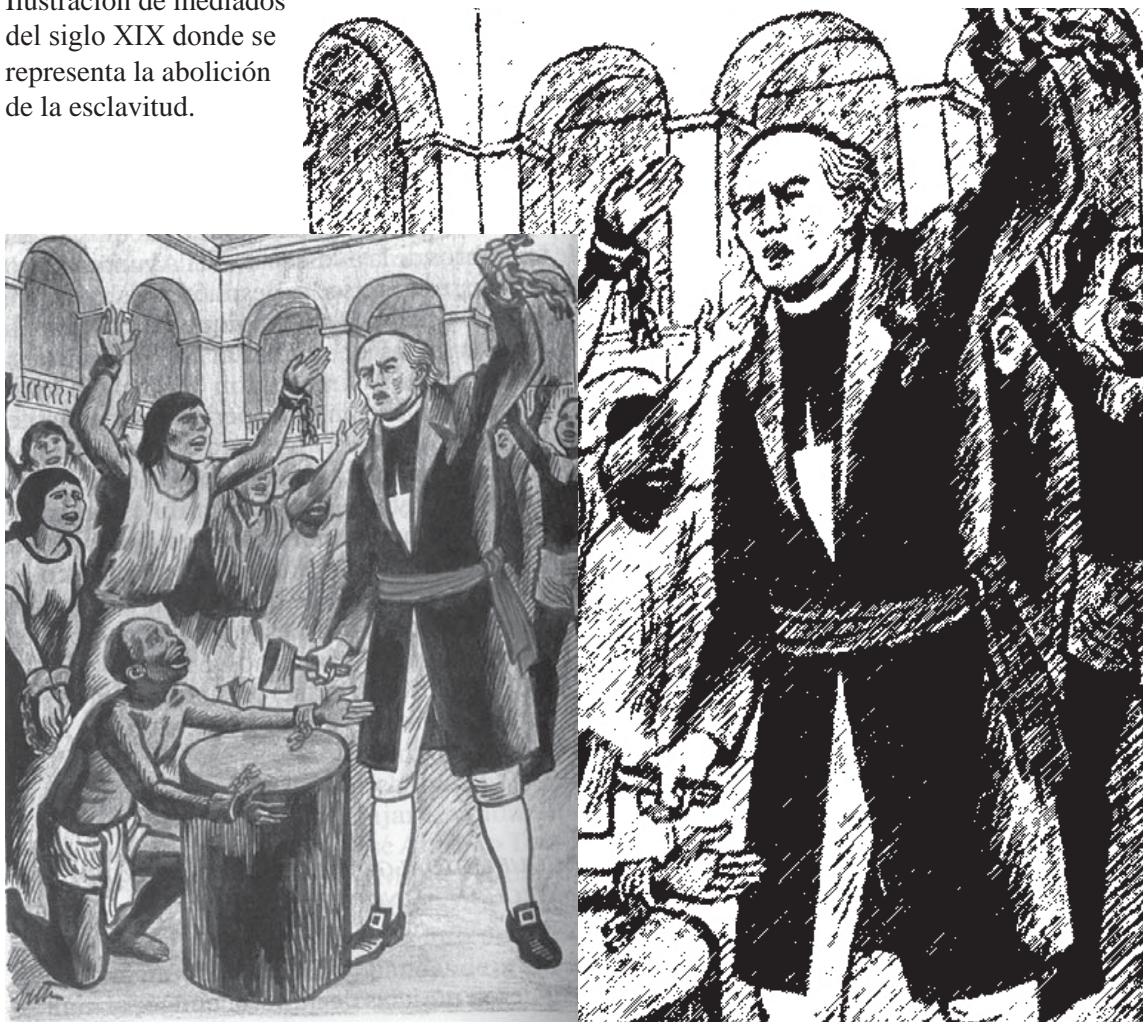
Ilustración de mediados del siglo XIX donde se representa la abolición de la esclavitud.

Si bien lo anterior es un hecho encomiable en esta nueva etapa de la historia humana, resulta de interés observar algunos aspectos de tipo histórico y jurídico que han sido