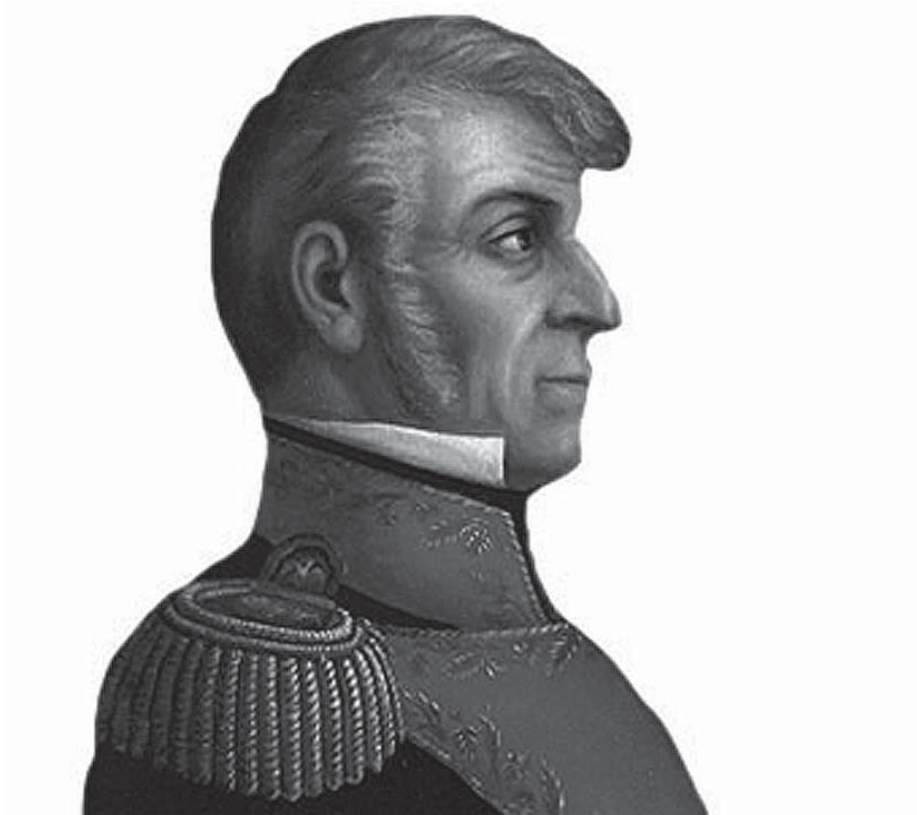
Gral. Ignacio López Rayón.