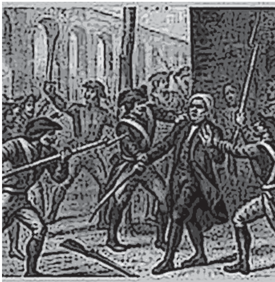
Aprehensión de Morelos.

Art. 18°. Ley es la expresión de la voluntad general en orden a la felicidad común: esta expresión se enuncia por los actos emanados de la representación nacional.