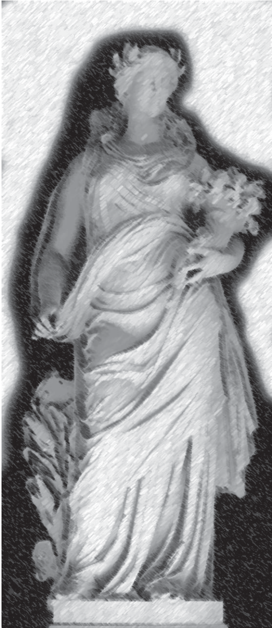
Alegoría sobre la Paz.

Art. 35°. Ninguno deber ser privado de la menor porción de las que posea, sino cuando lo exija la pública necesidad; pero en este caso tiene derecho a la justa compensación.