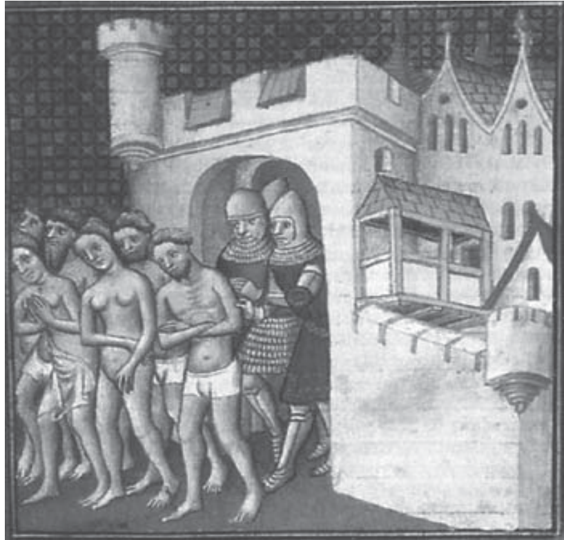
Expulsión de los Cátaros.

caverna de ladrones: Speluncam latronum ese. 6