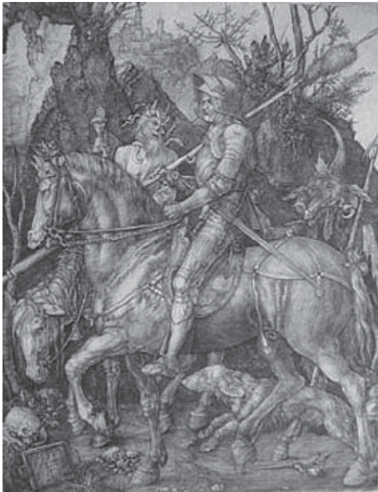
Alberto Durero: El caballero, la muerte y el diablo.

“Nos queremos que los obispos declaren desligados por autoridad apostólica a