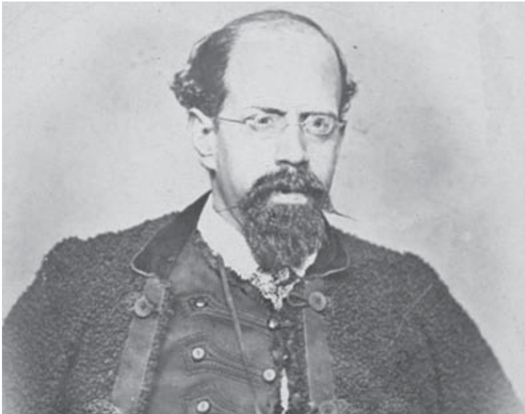
Vicente Riva Palacio.

conclusión que los indígenas no representaban peligro para la fe católica y que solo había que convencerlos- por la buena o por la mala- de adquirir la nueva religión . 22