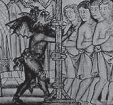
Representación del demonio en miniatura medieval.