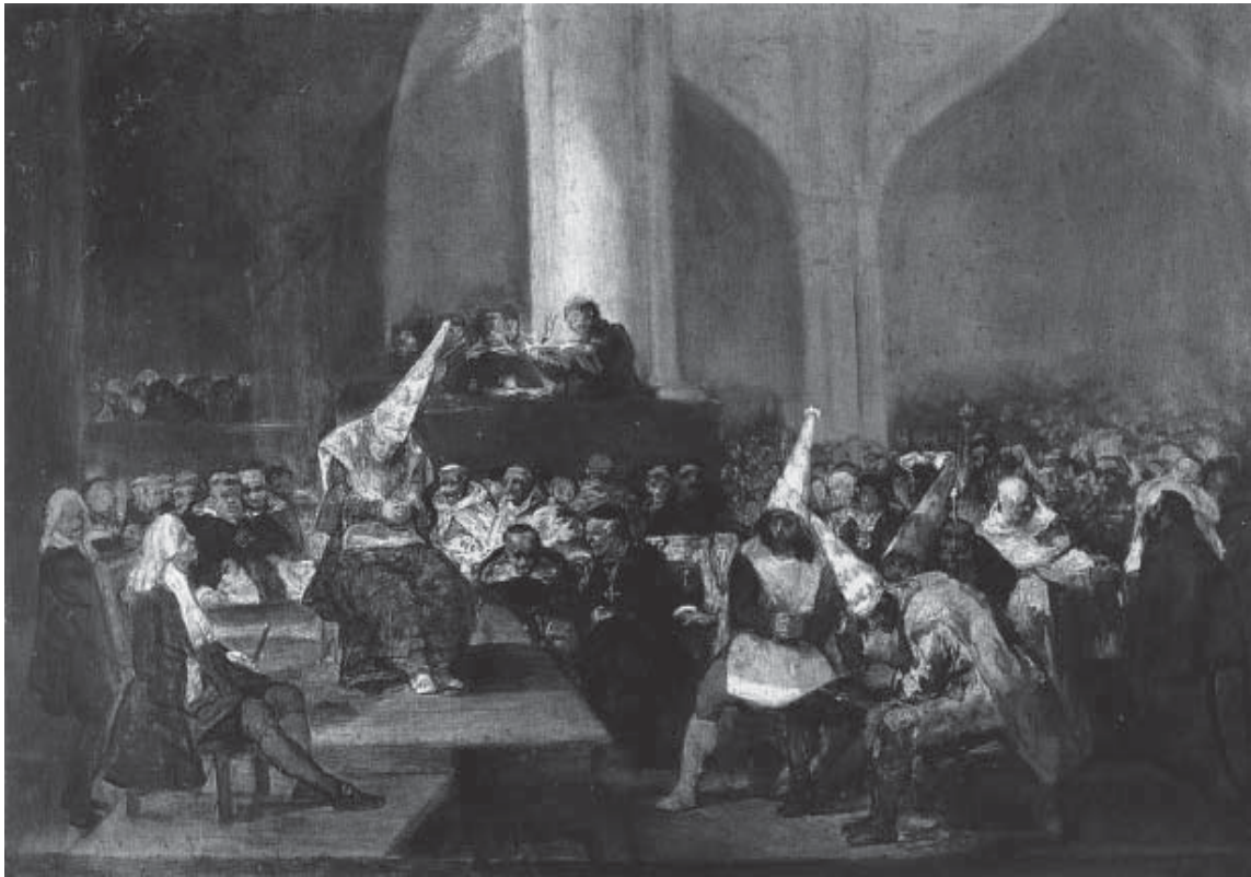
Auto de fe de la Inquisición. Francisco de Goya

Daremos algunos ejemplos de ambos para adentrarnos en esta parte de nuestra historia.