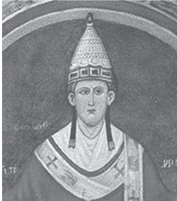
Papa Inocencio III.