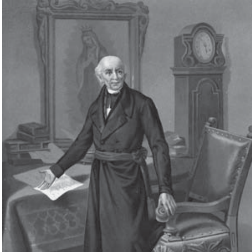
Miguel Hidalgo y Costilla.

consonancia con el miedo que le tenían a los vientos liberales que soplaban allende los mares y que sin duda impactarían las colonias de ultramar del vasto Imperio Español.